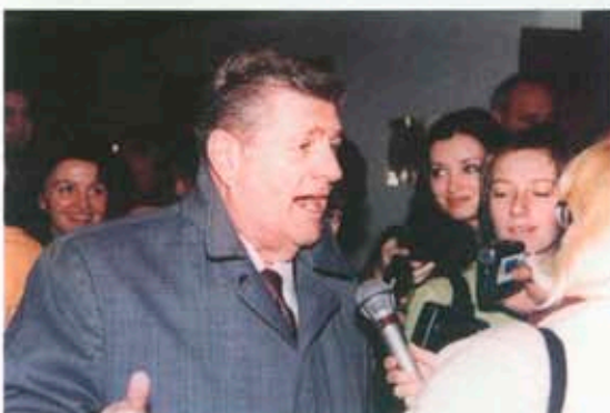
„Сърцето ми остава в София...“