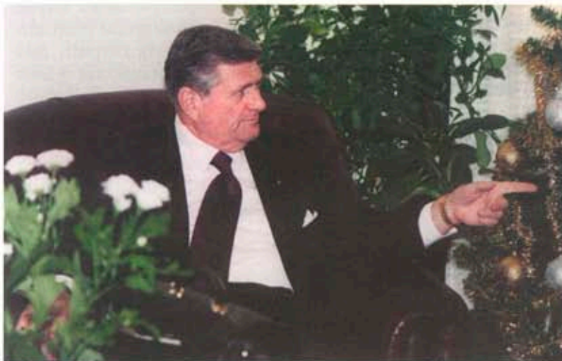
Скъпите гости, преди да отлетят от България

Забележка: Пълен финансов отчет и участието на клубовете от страната ще бъдат публикувани в следващия брой на сп. „Ротари в България“.